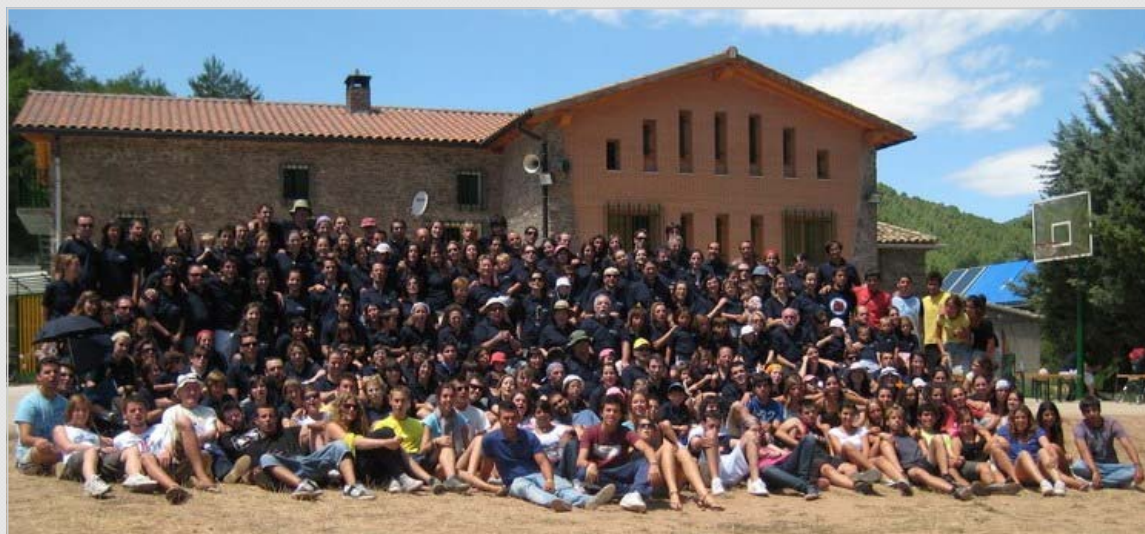
Salinas en Familia 2009

- 13 y 14 de Marzo Ejercicios de la Zona de Zaragoza