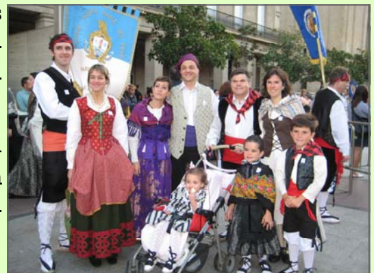
Fraternidad de Génesis en la Ofrenda

Así que allí estuvimos y la parroquia Santa Cruz y el Colegio Marianistas madrugaron para que la Virgen tuviera sus flores... y después el chocolate con churros tradicional, no nos lo quitó nadie.