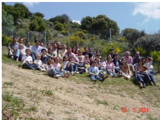
"Ejercicios Espirituales de matrimonios jóvenes con sus hijos en Robledo de Chavela"