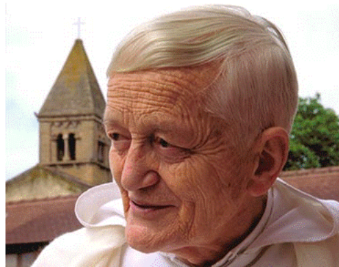
Hermano Roger, fundador y prior de Taizé (1915 – 2005)