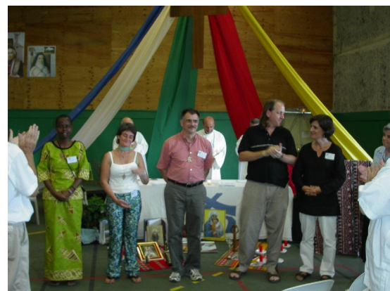
Nuestro nuevo equipo internacional elegido en Burdeos 2005.