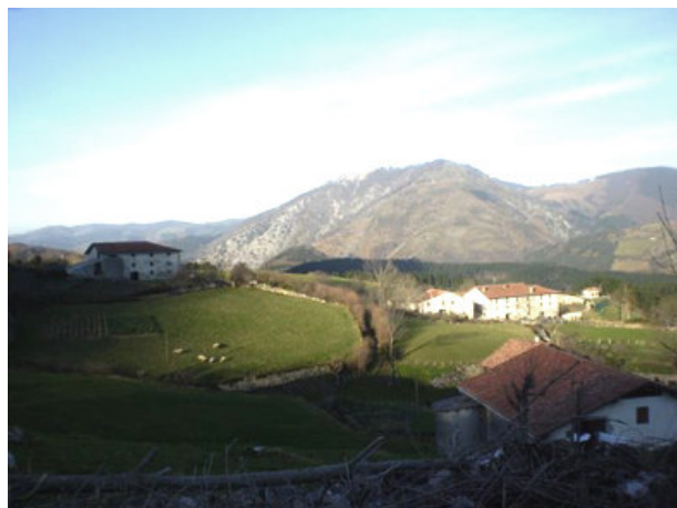
Vista de Azcarate

El tradicional encuentro de formación de verano para los hermanos más jóvenes, que se venía celebrando en el santuario de Nuestra Señora de la Cabeza, en Andújar (Jaén), se va a trasladar este año a Azcarate (Navarra). La gran novedad es que se va a celebrar conjuntamente con la provincia de Zaragoza. Aquellos que se hayan incorporado a su fraternidad en los últimos 3 años, o no pudieron acudir a alguno de los encuentros anteriores, tiene una cita entre los días 17 y 23 de julio. Este año se va a trabajar en torno al tema de la “Comunidad de Fe”. Los asesores de las fraternidades de jóvenes tienen más detalles de esta actividad trascendental para la vida de los nuevos hermanos.