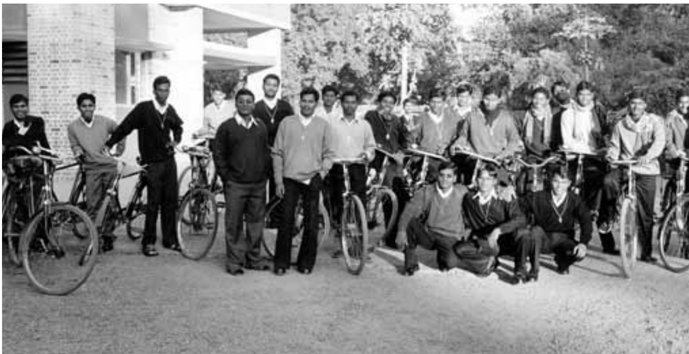
Novicios marianistas dispuestos a ir a misa a la parroquia cercana... a 7 kilómetros.

Solamente me queda dar las gracias a esta tierra donde me he sentido tan acogido. Creo que el vivir esta realidad me ha renovado por dentro, me ha purificado en mis motivaciones y me ha invitado a seguir caminando con ilusión, con fe, entregándome, desde un corazón más libre, a aquella misión que la Compañía de María, esa comunidad de la que tanta vida y tanta fe he recibido, me envíe. ¡Hasta siempre, India! O hasta la vista, quién sabe.