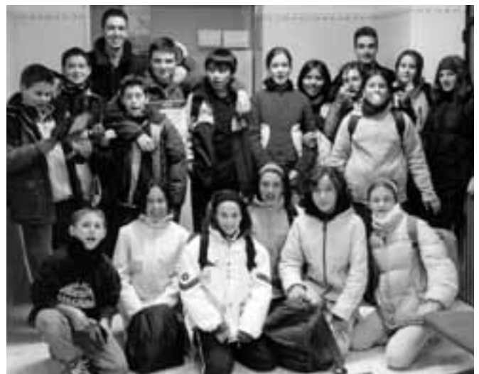
Uno de los grupos SENDA regresando de una excursión.

SENDA no es un camino, son muchos caminos. SENDA es una forma intensa de recorrerlos todos. SENDA eres tú, somos nosotros. SENDA es Jesús, el camino... de los que buscan la verdad, de los que aman la vida.