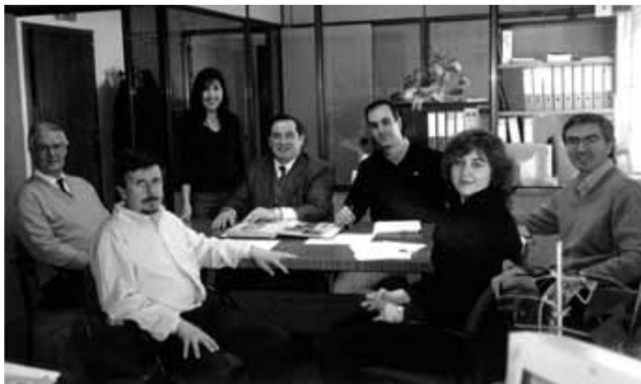
Miembros del Comité de Dirección de la FEMDL en su sede.

Los colegios que componen la FEMDL son: Ntra. Sra. del Pilar de Pola de Lena, Ntra. Sra. del Pilar de Valladolid, Ntra. Sra. del Pilar de Madrid, Santa María del Pilar de Madrid, Hermanos Amorós de Madrid, Ntra. Sra. del Prado de Ciudad Real, Ntra. Sra. del Pilar de Jerez de la Frontera y San Felipe Neri de Cádiz. Como veis, todos los de la Provincia de Madrid salvo Santa Ana, que ya era Fundación.