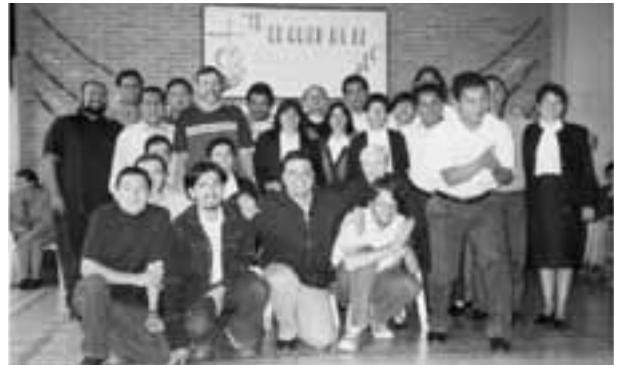
Participantes en el encuentro de Chinauta (Colombia).

Como es tradicional, cada cuatro o cinco años, los religiosos temporales se reúnen en un encuentro para profundizar algunos temas, compartir las riquezas del carisma marianista, experiencias y desafíos. Este año fue en Chinauta (Colombia).