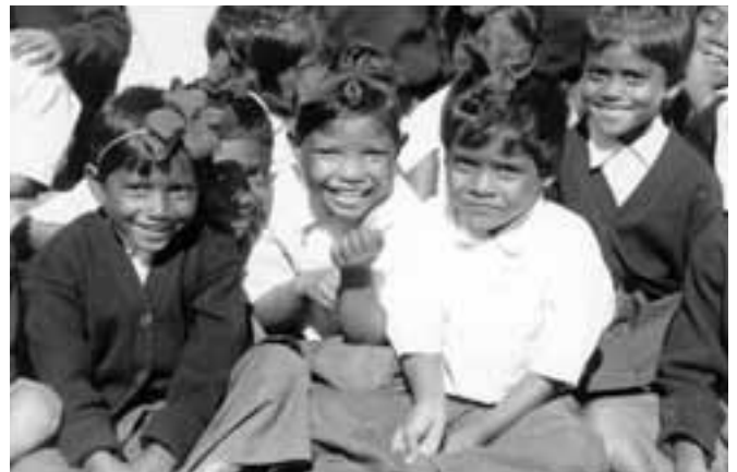
Los alumnos más pequeños del colegio de Singhpur.

Muchos candidatos llegan a Faustino Nilaya (nilaya=casa), el aspirantado, en Deepahalli (un complejo de tres comunidades a las afueras de Bangalore). Durante un año estudiarán, fundamentalmente, inglés, la lengua que les permitirá comunicarse ya que la mayoría de ellos sólo saben hablar su lengua materna –hindi, telegu, tamil, kanada...– y, por supuesto, se iniciarán en la vida religiosa. De los cuarenta que pueden iniciar el aspirantado, en torno a la mitad llegan a Nirmal Deep , el noviciado a las afueras de Ranchi. Durante dos años van purificando motivaciones y encontrando la voluntad del Señor por medio de la oración, los estudios y la vida de comunidad. En el 2003 fueron 13 los hermanos que hicieron su primera profesión. Tras un año de misión en distintas comunidades, volverán a Deepahalli, al Escolasticado , en donde durante tres años recibirán una sólida formación filosófica.