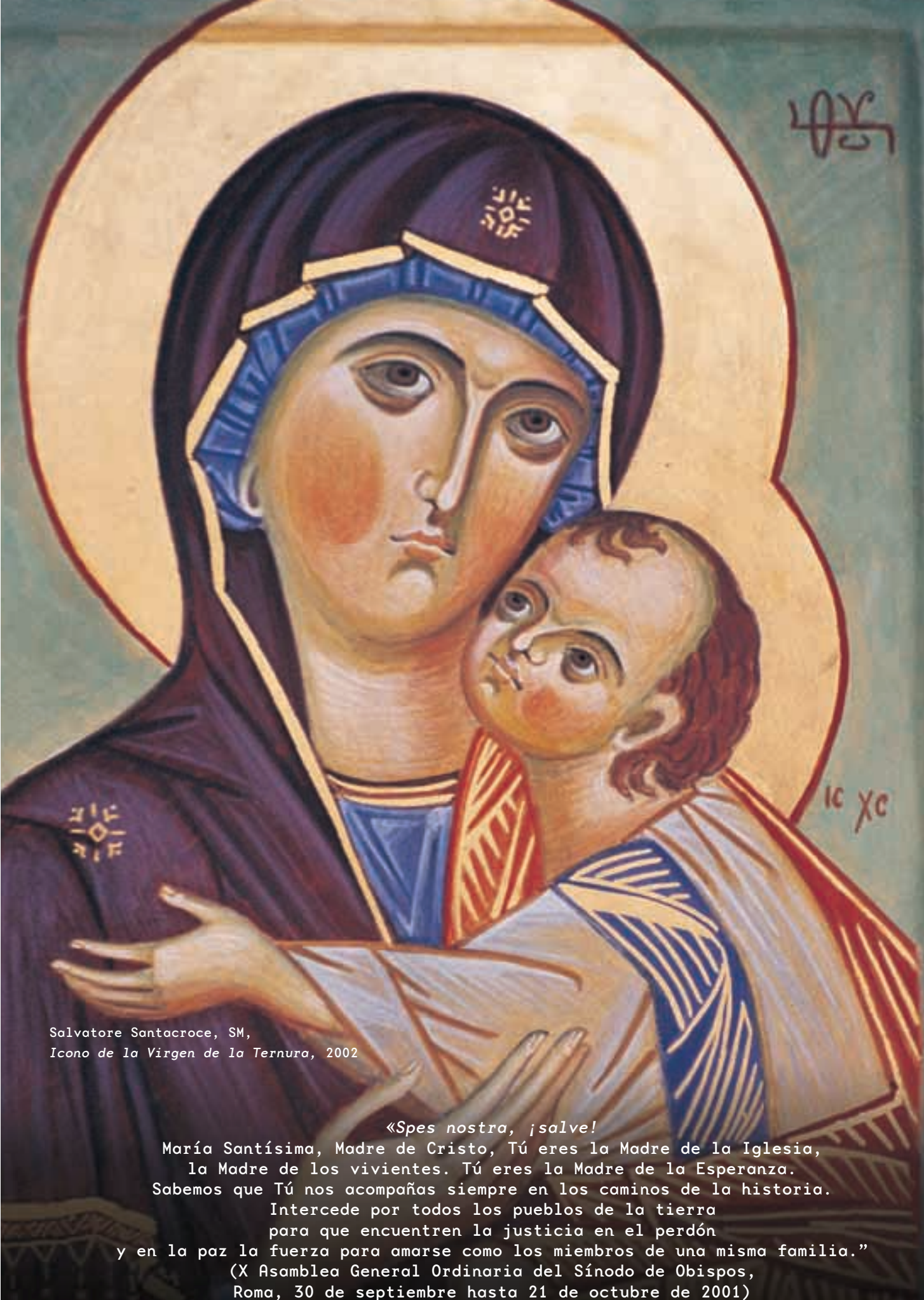
Salvatore Santacroce, SM, Icono de la Virgen de la Ternura, 2002

«Spes nostra, ¡salve! María Santísima, Madre de Cristo, Tú eres la Madre de la Iglesia, la Madre de los vivientes. Tú eres la Madre de la Esperanza. Sabemos que Tú nos acompañas siempre en los caminos de la historia. Intercede por todos los pueblos de la tierra para que encuentren la justicia en el perdón y en la paz la fuerza para amarse como los miembros de una misma familia.» (X Asamblea General Ordinaria del Sínodo de Obispos, Roma, 30 de septiembre hasta 21 de octubre de 2001)