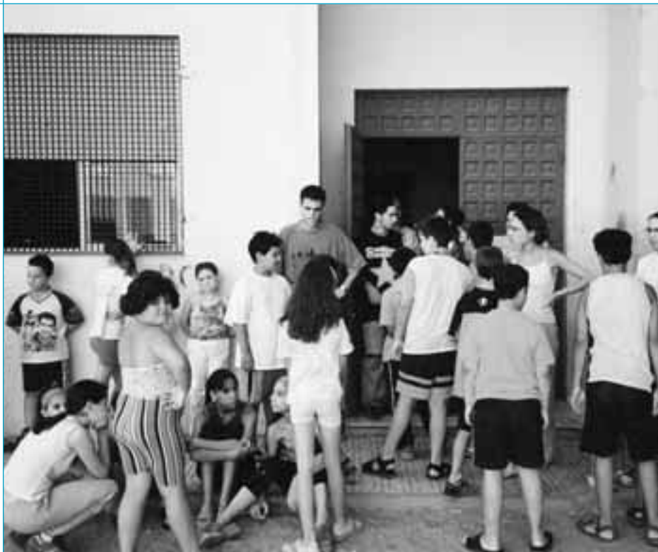
Los voluntarios con los niños durante una de las actividades del campo de trabajo en el Gurugú, Badajoz.