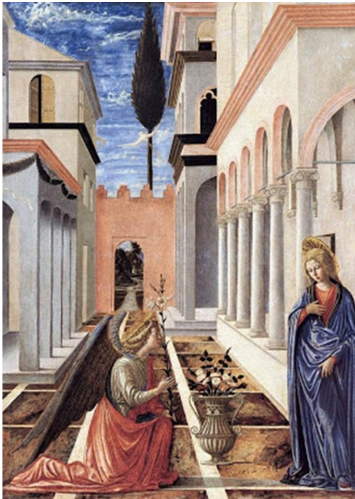
La Anunciación de : f U m' 7 U f b Y j U` Y c. 1448. Temple sobre madera