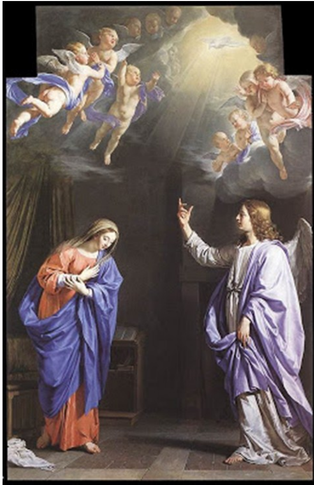
La Anunciación de Philippe de Champaigne (1645) Oleo sobre lienzo