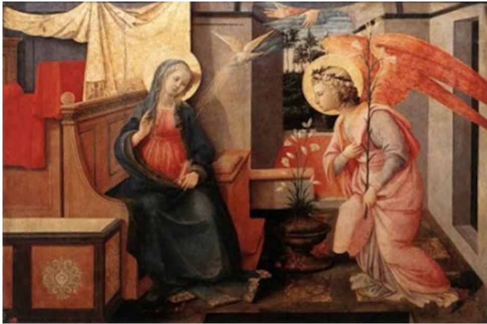
Fray Filippo Lippi 1443