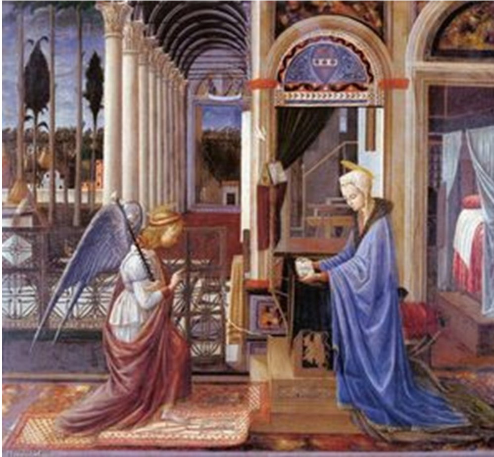
Fra Carnele La Anunciación 1445 Tempera