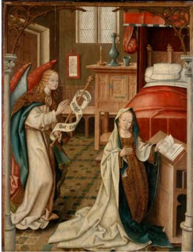
Dierck Bouts La Anunciación (1445)