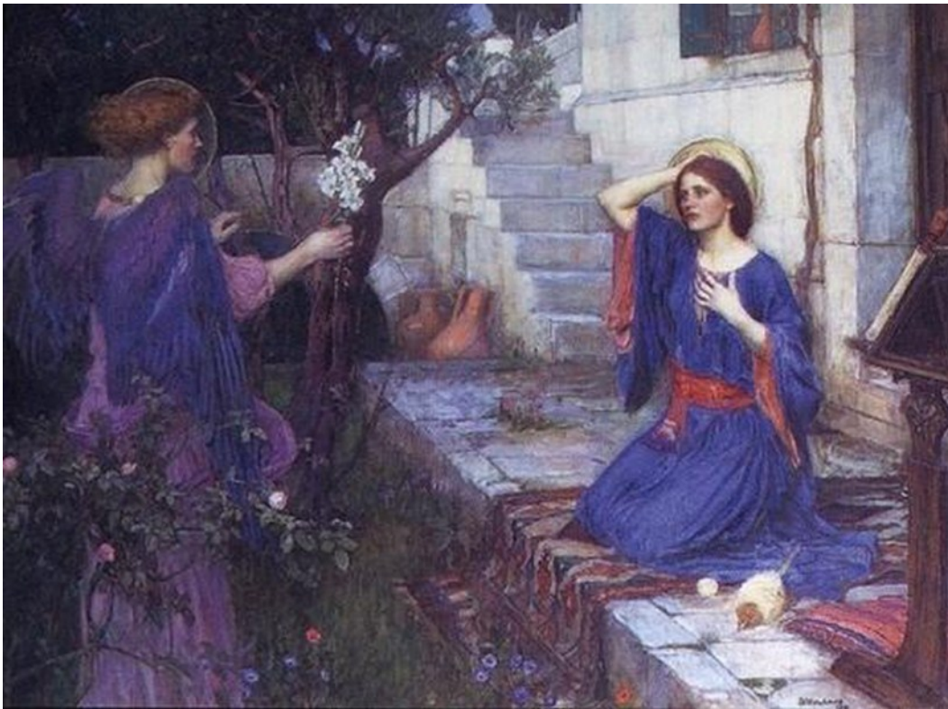
La Anunciación, óleo sobre lienzo de John William Waterhouse Ç F Ì - F J F İ Ê Á Q c æ | ^ D