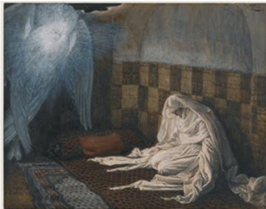
La Anunciación de James Tissot (1836 – 1902) Francia