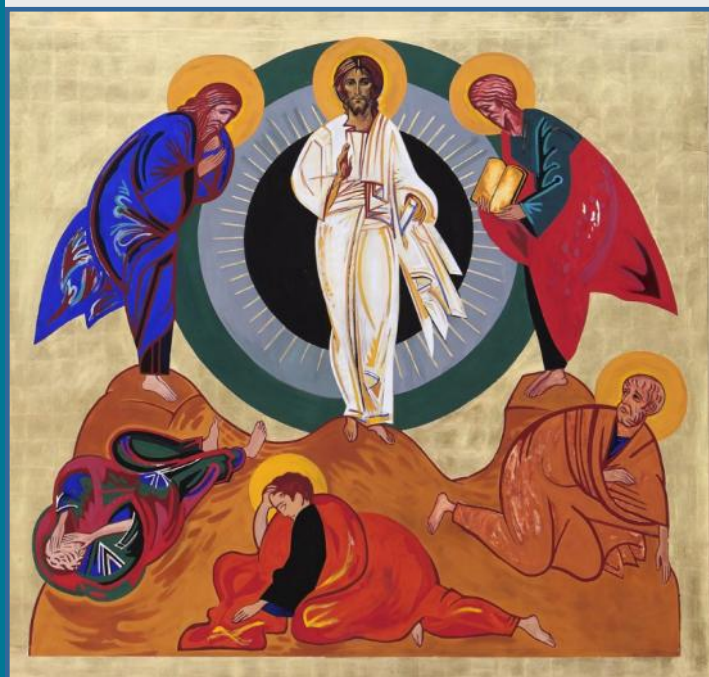
Icono de la transfiguración, pintado por Kiko Argüello

Este mes de febrero, el encuentro mensual de la fraternidad de Barcelona ha estado centrado en la preparación de la Cuaresma como un tiempo de conversión, que nos ayuda a caminar hacia la gran fiesta de la Pascua; un tiempo para cambiar algo de nosotros, para ser mejores y poder vivir más cerca de Cristo. En definitiva, un tiempo de perdón y de reconciliación fraterna.